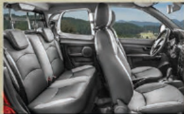
VERSIÓN CLUB CAB