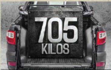
CAPACIDAD DE CARGA DE HASTA 705 K