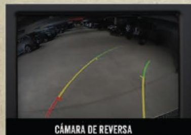
CÁMARA DE REVERSA