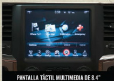
PANTALLA TÁCTIL MULTIMEDIA DE 8.4"