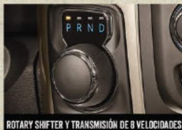
ROTARY SHIFTER Y TRANSMISIÓN DE 8 VELOCIDADES