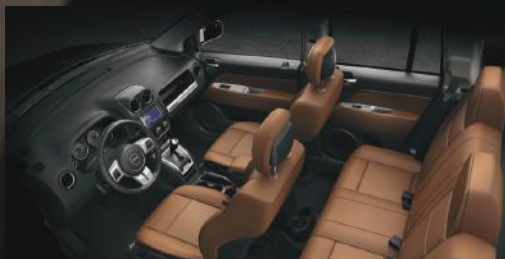
Asientos con piel en color marrón.