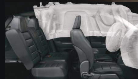
Bolsas de aire frontales y laterales tipo cortina.