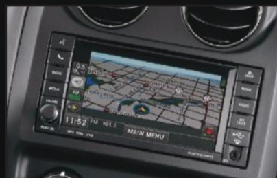
Sistema Multimedia Uconnect®.