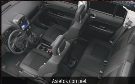
Asientos con piel.