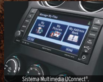
Sistema Multimedia Uconnect®.