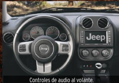
Controles de audio al volante.