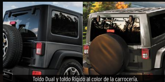
Toldo Dual y toldo Rígido al color de la carrocería.