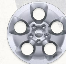
Aluminio de 18" Versión Sahara