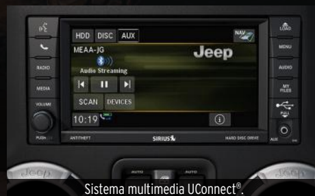
Sistema multimedia UConnect®.