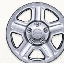
Acero estilizado de 16" Versión Sport