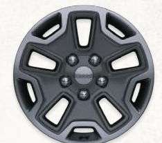
Aluminio de 17" Versión Rubicon