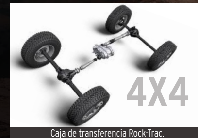
Caja de transferencia Rock-Trac.